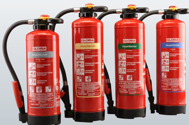
Pulver Schaum Öko-Tipp Wasser